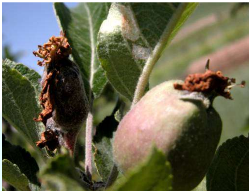
Фото 27: Монилиоз дар ғураи себ (аз чап).