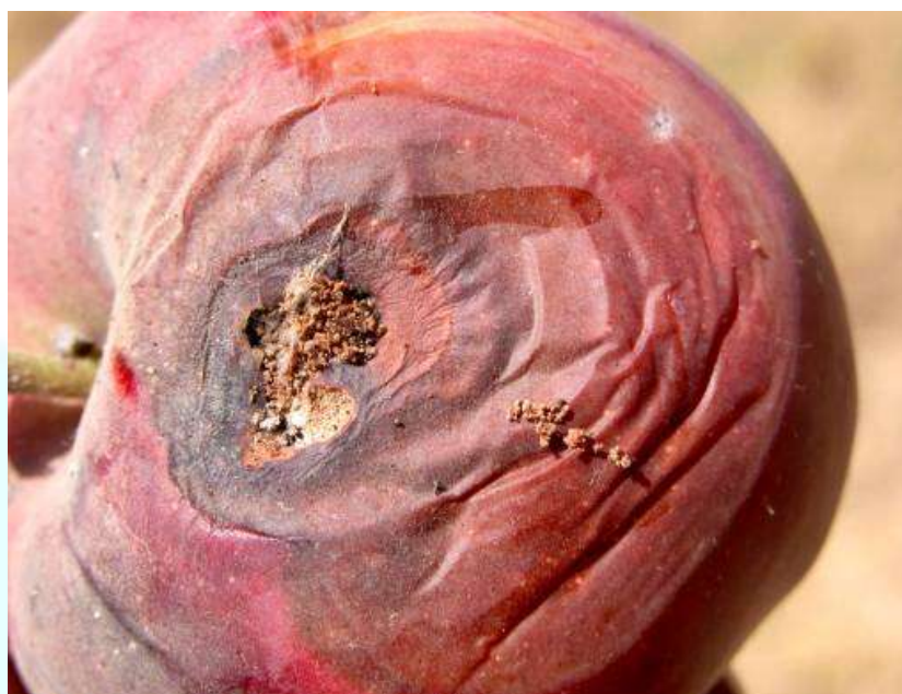
Фото 29: Инкишофи монилиоз ва бактерияҳо дар меваи себ баъди зарари кирминаи себ.