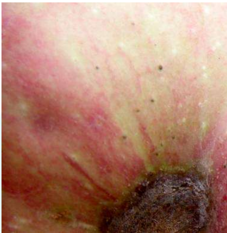
Фото 23: Нишонаҳои қутур дар меваи себ.