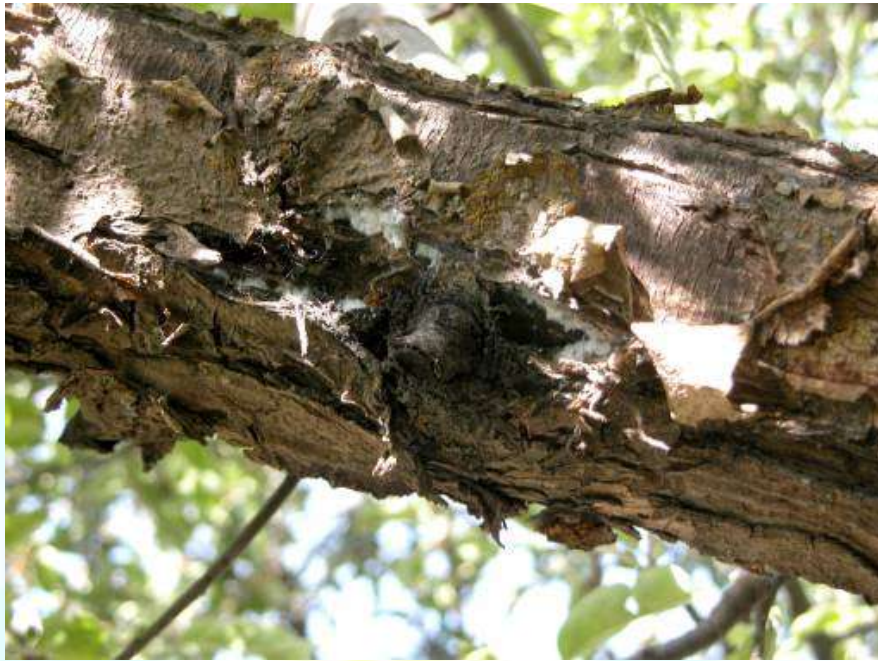
Фото 12: Нишонаҳои зарари аз ширинчай сурхи хунин расида (ба хати ишора нигаред), ки дар зоҳир ба саратони дарахт монанд аст.

1.5. Сипарболак ва сипарболакмонанд, сипарболаки качмонанд ( Lepidosaphis ulmi ), сипарболаки лӯндаи тӯронӣ ( Phodococcus turanicus ), сипарболаки ақоқийӣ ( Parthenolecanium corni ), сипарболаки калифорниягӣ ( Quadrospidiotus perniciosus ).