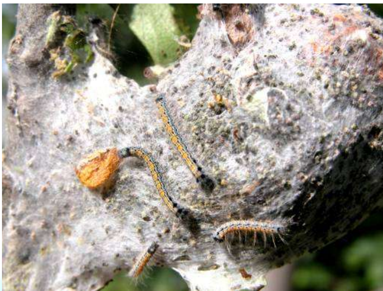
Фото 4: Кирминаҳои миттаи себ дар лонаҳои тортанидаашон.