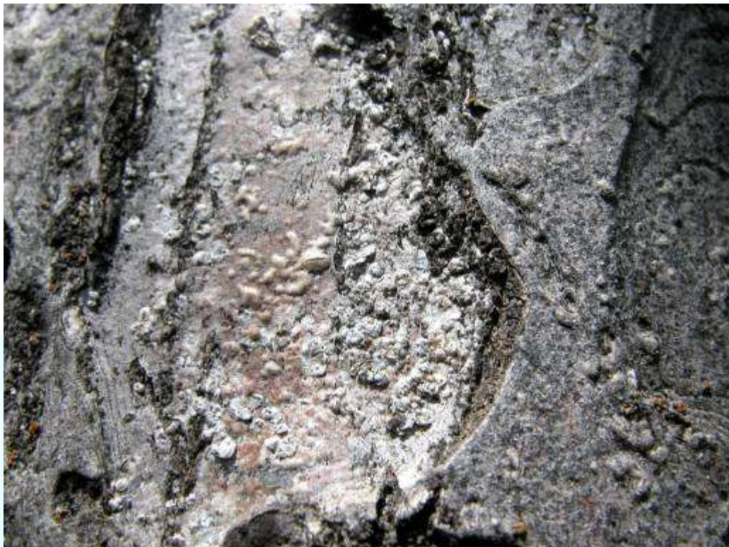
Фото 16: Зарар дидани пӯсти танаи дарахт аз сипарболаки качмонанд.