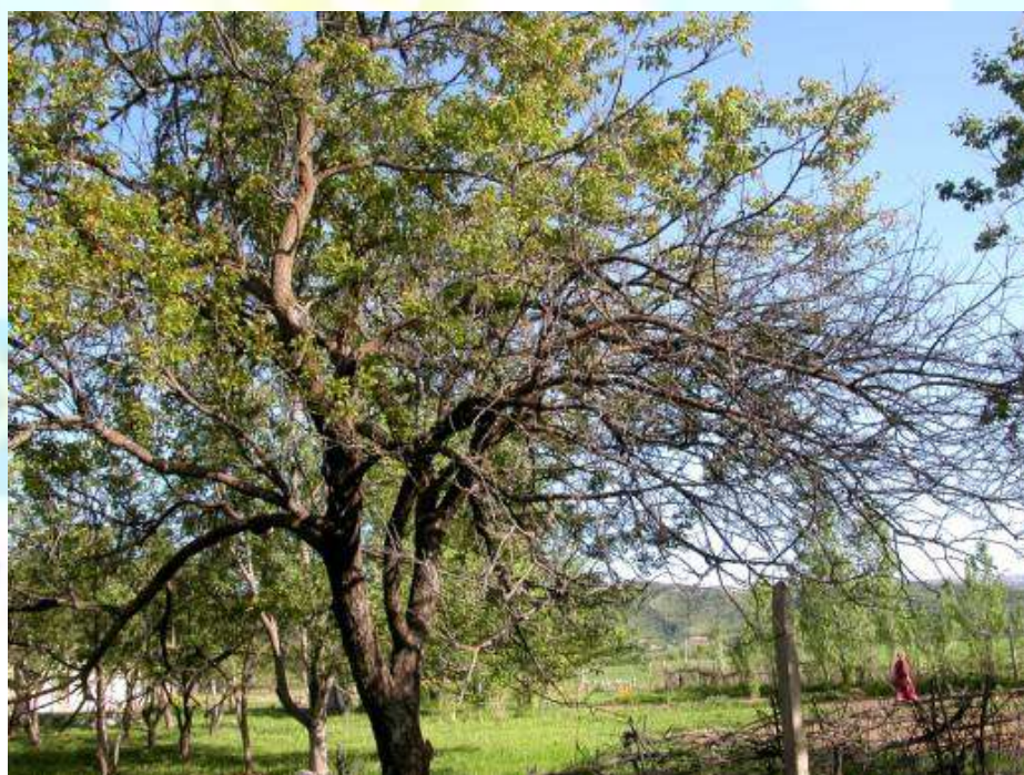
Фото 30: Дарахти талафшудаи себ, ки аз сирояти монилиоз пеш омадааст.