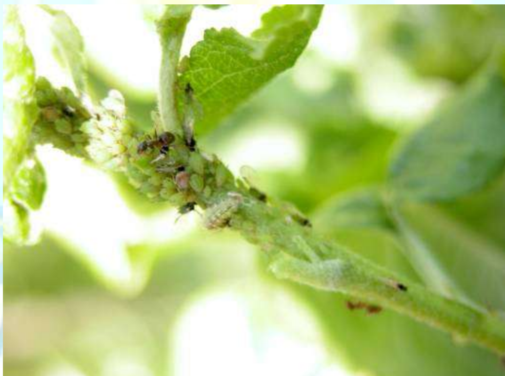
Фото 7: Ширинчаи сабзи себ ва мӯрчаҳо, ки ахлоти ширини онро меҳӯранд.

Баргҳои аз ширинча осебдида қачу қилеб ва ноҳамвор мешаванд ва навдаҳое, ки дар онҳо зараррасонҳо ҷойгир мешаванд, хеле суст афзоиш меёбанд (расмҳои 8-10). Ширинча дар марҳалаи тухмак будан дар шоҳаҳо зимистонро паси сар менамояд. Қирминаҳои ширинчаи хундор зимистонро дар решаҳои дарахти себ мегузаронанд (расмҳои 11,12). Баҳорон қирминаҳо ба шоҳҳо боло шуда, шираи онҳоро мақида мегиранд, ки пас аз ин варам кардан ва қачу қилеб шудани навдаҳо ба амал меоянд. Дарахтони дар онҳо ширинчаи хундор ҷойгиршуда суст инкишоф карда, тадричан талаф мешаванд. Дар давраи афзоиш ширинча то 15 насл медиҳад.