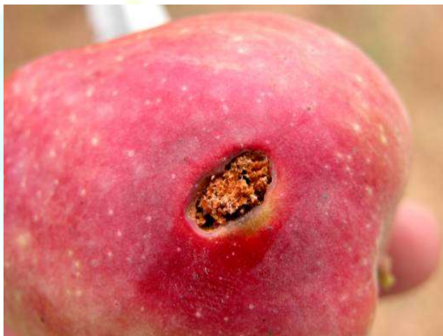
Фото 2: Чой ва роҳи воридшавии насли дуҷуми кирми себ.