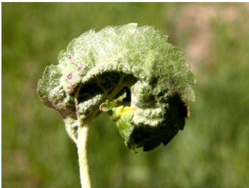
Фото 8: Дар натиҷаи зарар расонидани ширинчаи сабзи себ барг қачу килеб ва ноҳамвор шудааст.