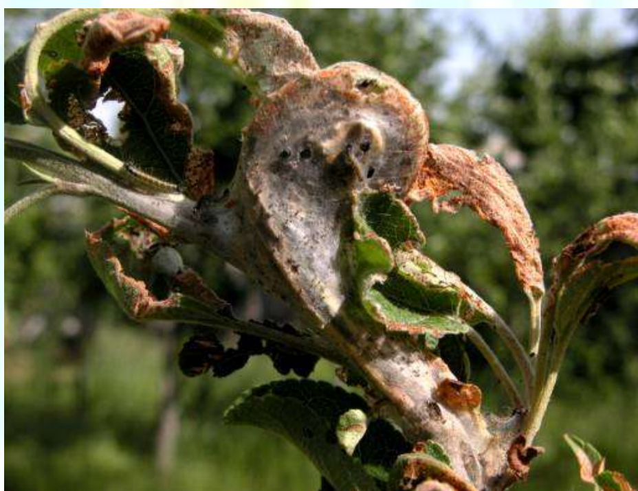
Фото 5: Лонаҳои тортанидаи миттаи себ дар навдаҳои ҷавон.