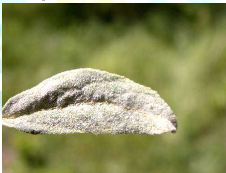
Фото 25: Ордак дар барги себ.

Навъҳои себҳои ренети бухардт, заилӣ, апорт, александр, ренети симиренко, бойкен аз ин касалӣ зарар мебинанд. Navъҳои кандил, синап, голден делишес ва пармени тиллоии зимистонӣ тобовар мебошанд.