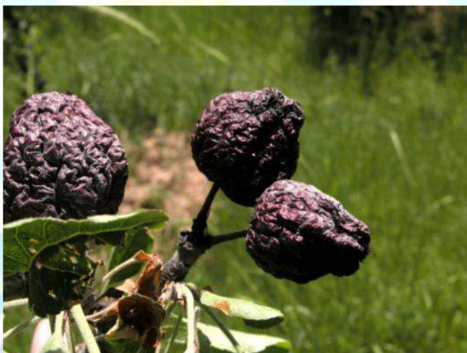
Фото 28: Меваи мумшуда, ки аз монилиоз пеш омадааст.