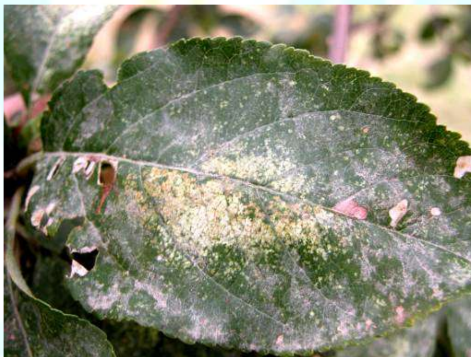
Фото 22: Барге, ки аз чирчираки сабз осеб дидааст.

Ин зараррасон дар хама чо пахн шудааст ва ба ниҳолхонаю боғҳои чавони себ бештар осеб мерасонад. Чирчираки сабз ба пӯстлохи навдаҳои чавон осеб расонида, барои тухмгузори ҷой фароҳам месозад. Зимистонро зери пӯсти шоҳу навдаҳо паси сар мекунад (расми 22).