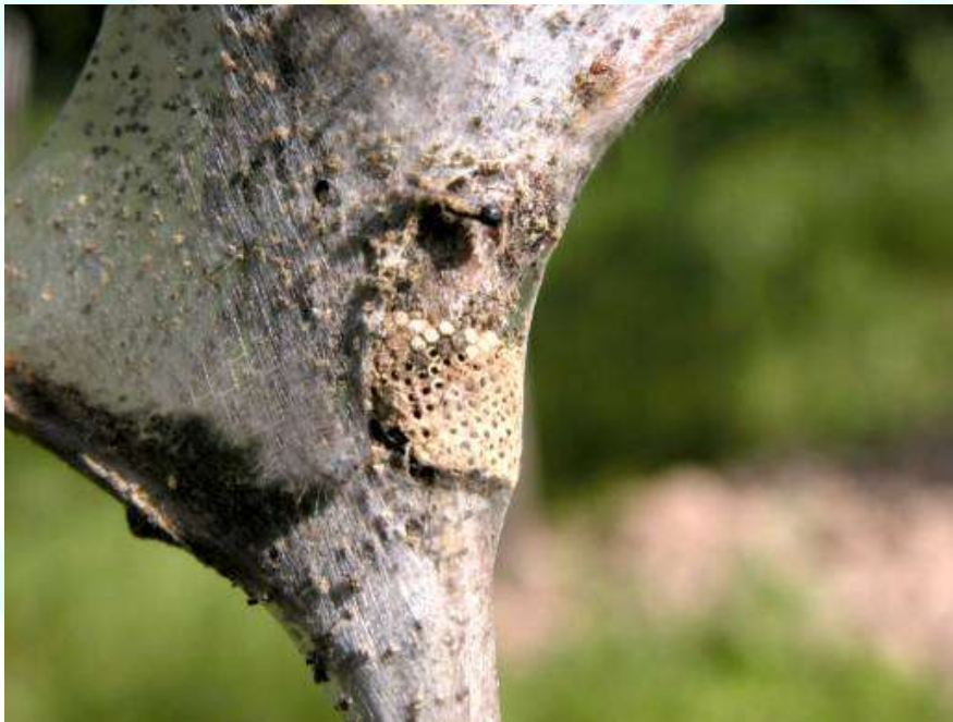
Фото 6: Тухмакҳои гузоштаи пилларесаки ҳалқагии кӯҳӣ.

баъди чуфтшавӣ дар шохаҳои дарахт тухм мегузоранд (расми б). Тухмгузорӣ мисли ҳалқаи калон аст, ки тамоми шохаро печонида мегирад. Ин зараррасон соле 1 маротиба насл медихад. Дар мавриди то муғҷабандӣ гузошта шудани 0,5-1 тухмак дараҷаи баланди зараррасонӣ ҳисоб меёбад.