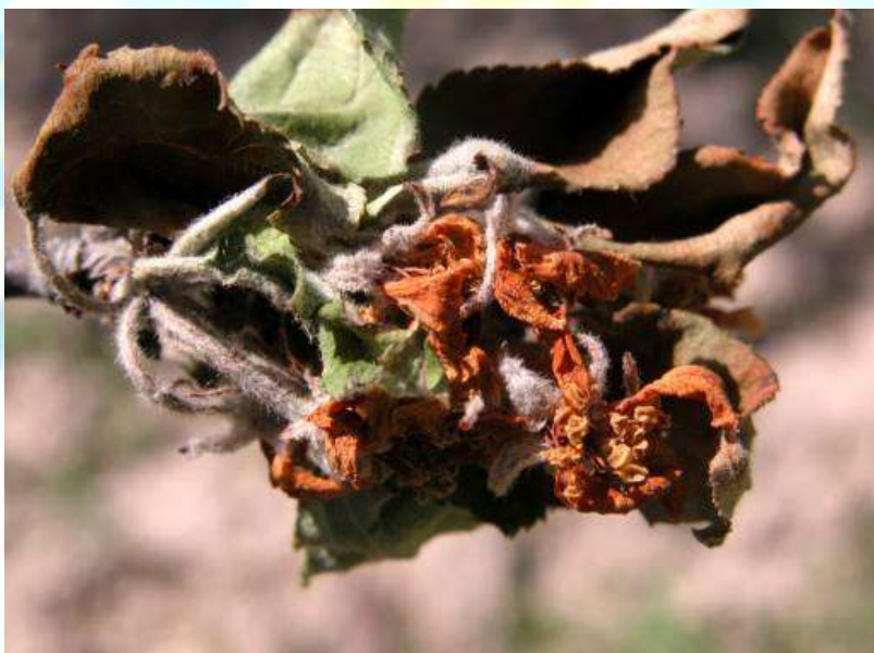
Фото 26: Монилиоз дар гулҳои себ.

Навъҳои апорт, заилӣ, белый налив, ренети бухардт, салтанат, плесетский зимистона аз ин касалӣ зарар мебинанд. Навъҳои қонатан, мелба, синапи шимолӣ, мутсу ва милтон тобовар ҳисоб меёбанд.