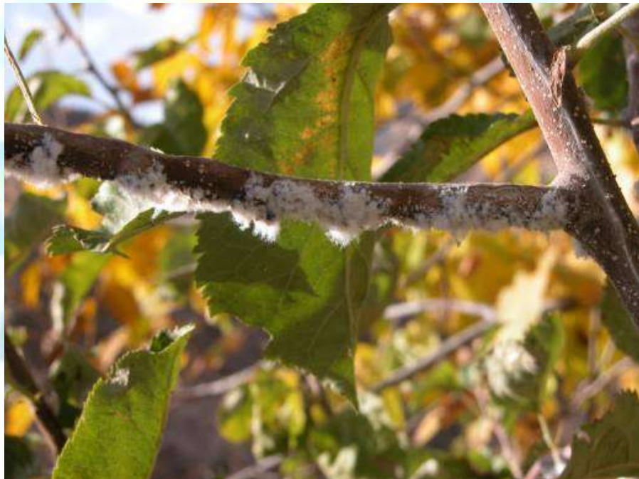
Фото 11: Навдаҳо аз ширинчай хунини себ зарар дидаанд.