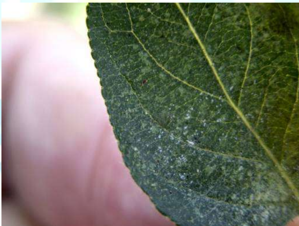
Фото 21: Нишонаҳои осеб аз канаи қаҳваранги себ.