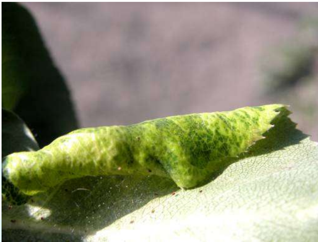
Фото 20: Печидашавии барг, ки аз тортанакканаи боғӣ пеш омадааст (ба хати ишора нигаред).