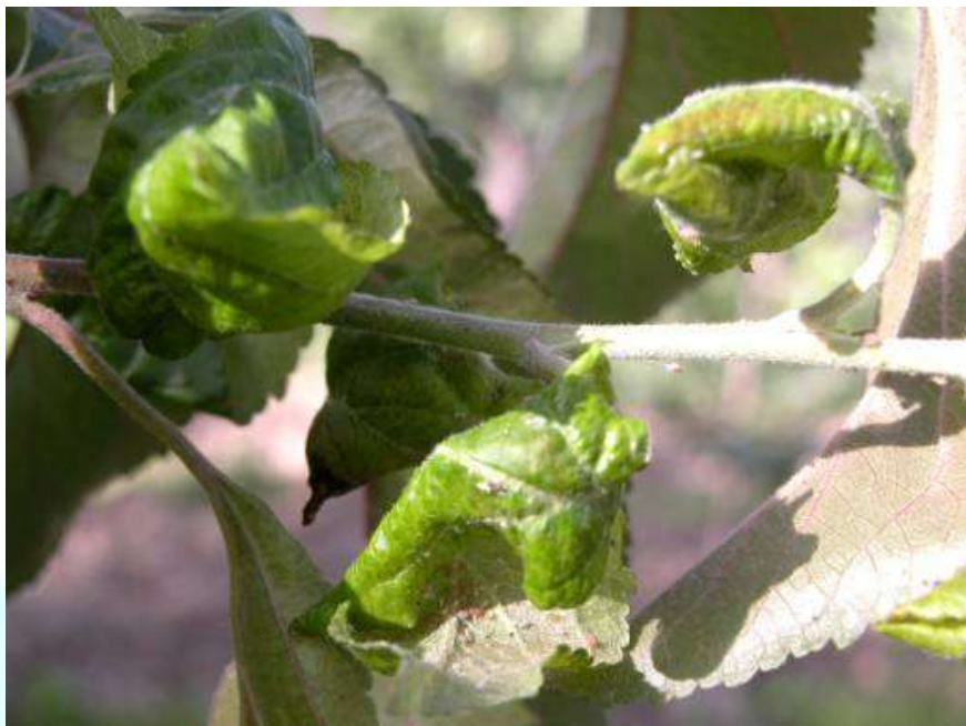
Фото 10: Аз таъсири ширинчай ордаки себ нӯги навдаҳо зарар дидаанд.