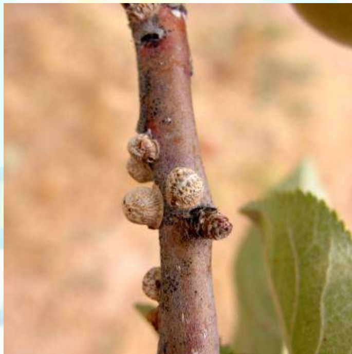
Фото 17: Сипарболаки калифорниягӣ дар навдаи чавон.