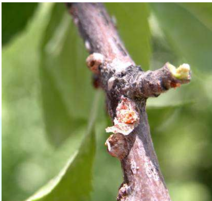
Фото 18: Модинаҳои сипарболаки калифорниягӣ ва тухмакҳои он.