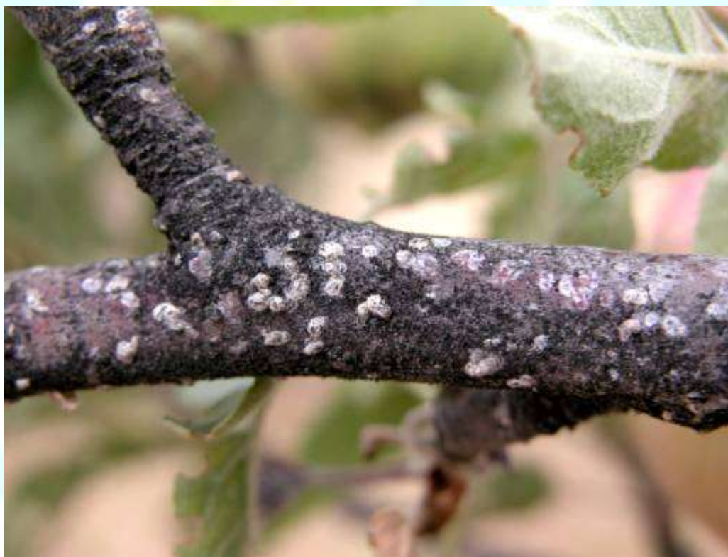
Фото 15: Зарар дидани шохҳои дарахт аз сипарболак.

Фото 14: Осеби аз сипарболаки калифорниягӣ расида, ки ба пӯсиш боис мегардад.