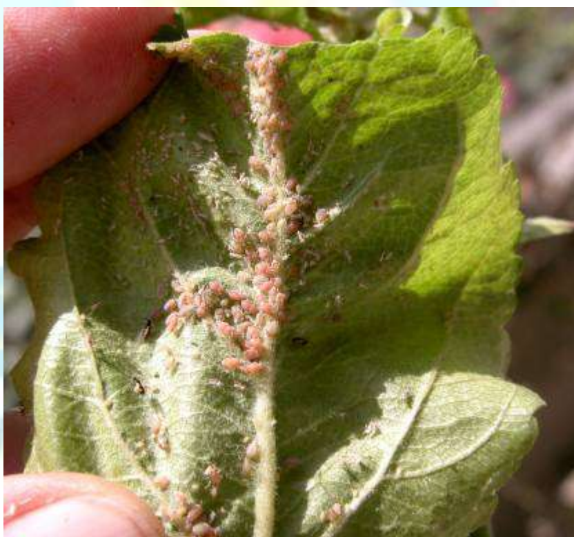
Фото 9: Ба таври оммавӣ зарар расонидани ширинчаи ордаки себ.