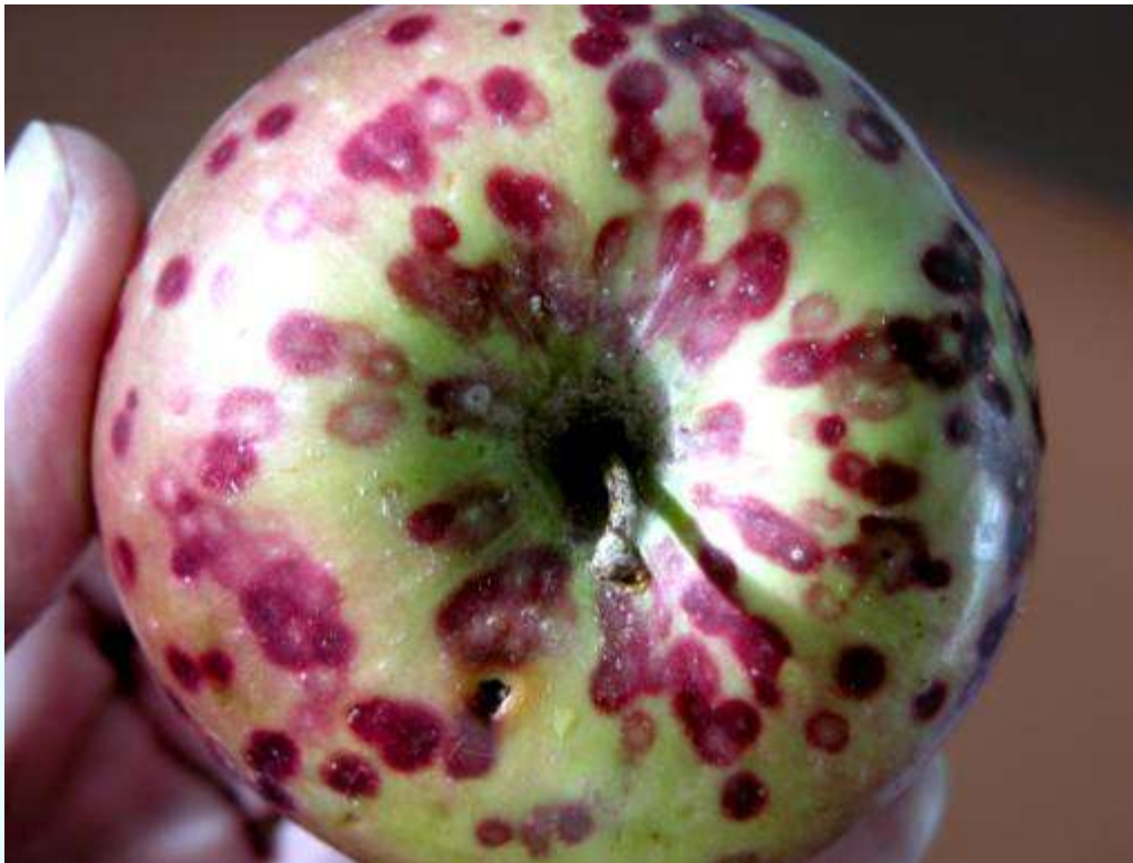
Фото 13: Доғхое, ки дар меваи себ аз таъсиррасони сипарболаки ақоқиёии калифорниягӣ пеш омадаанд.