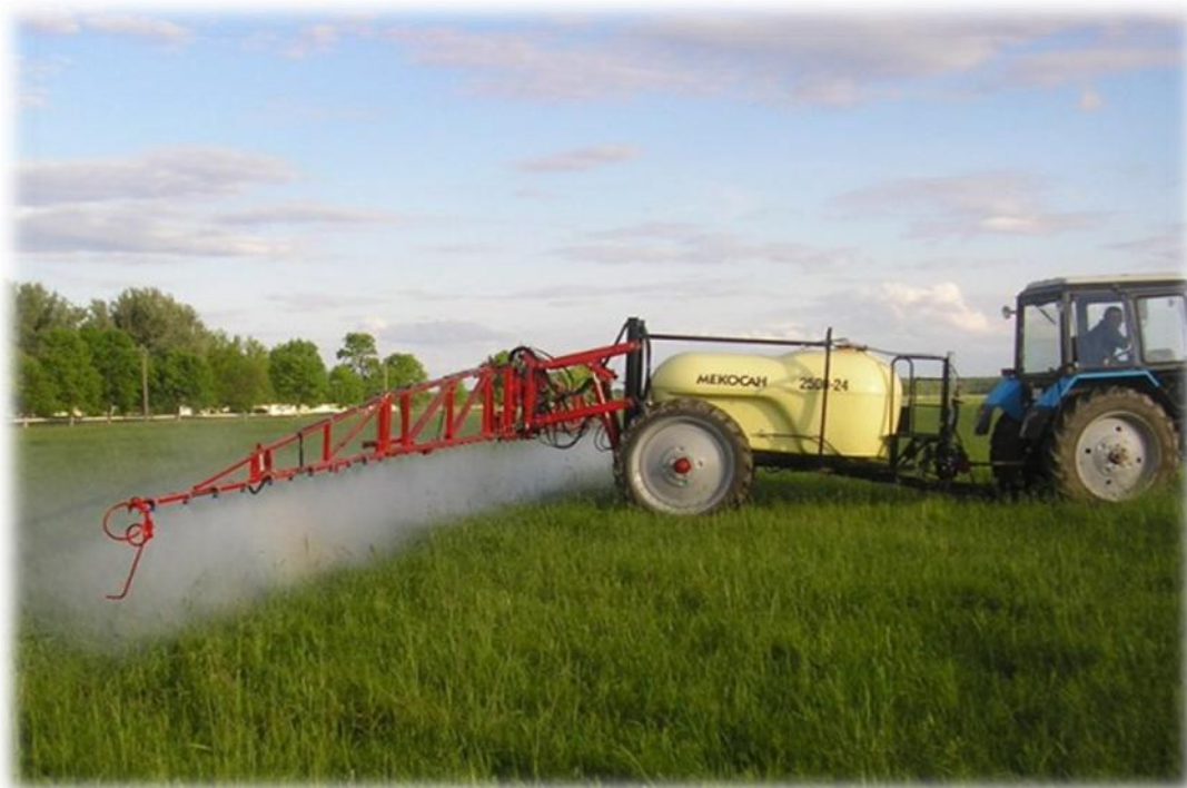
Коркарди кимёвӣи зироатҳои кишоварзӣ

Моддаҳои кимёвӣ бо назардошти ҳолати фитосанитарии киштзорҳо ҳатман паи ҳам истифода бурда мешаванд. Минбаъд дар муборизаи зидди ҳашаротҳо ва касалиҳо аз усули биологӣ истифода бурдан муфид аст. Зеро ин усул нмкониат медиҳад, ки дастовардҳои биотехнологӣ ва захрдоруҳои биологӣ васеъ истифода бурда шаванд. Масалан, дар Итолиё барои нест кардани касалии пусиши решаи ғаллагӣ биопрепарати трикотилро баровардаанд, ки барон ба даст овардани маҳсулоти тозаи биологӣ ба таври васеъ истифода бурда мешавад.