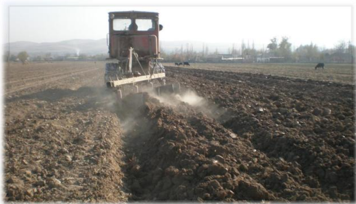
Коркарди асосии хок (чуқурии шудгор 25-30см)

Мувофиқи тавсияномаҳои Вазорати кишоварзии Тоҷикистон оиди парвариши зироатҳои ғалладонагӣ, шудгори заминҳои дамдодашудаи сиёҳ, тирамоҳи барвақт дар чуқурии 25-30 см бо испорҳои (плугҳои) ПН-3-35, ПЯ-4-35-и пешпозадор, ки ба тракторҳои ДТ-75, Т-4, Т-40 ва ғайра пайваस्त шудаанд, гузаронида мешавад.