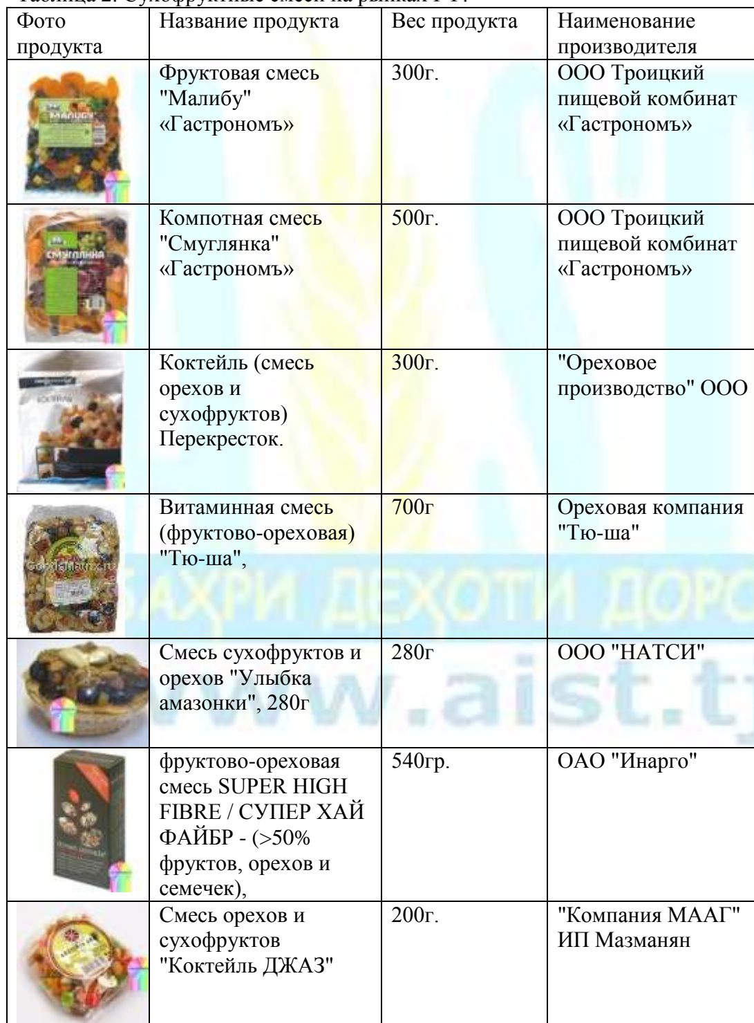
Таблица 2. Сухофруктные смеси на рынках РФ.

Ниже представлена таблица некоторых продуктов, которые имеются на рынке РФ, и будут представлять потенциальную конкуренцию новому таджикскому продукту.