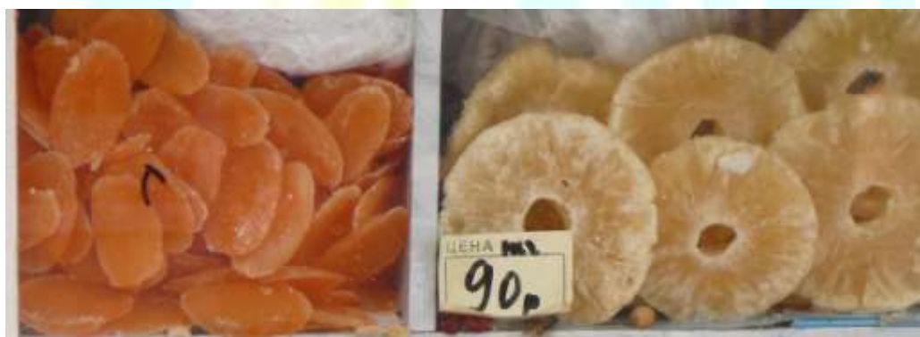
Рис 2. Формы, виды и цена цукатов на российском рынке. 2007 г.

При этом форма цуката должна быть привлекательной, цвет также должен быть натуральным и свойственен свежему продукту.