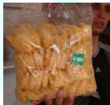
Рис 3. упаковка цукатов в кольцах, по 4 кг.

Цукаты для розничной торговли расфасовывают набором из не менее 4-х видов плодов в картонные коробки вместимостью до 1 кг или в пакеты из полимерных пленочных материалов, которые запаивают контактным сварочным аппаратом. Для промышленной переработки в деревянном ящике вместимостью до 10 кг укладывают цукаты 1-го вида.