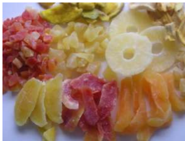
Рис.5 Фото цукатов из Тайланда.