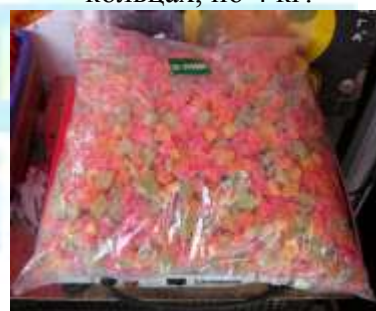
Рис 4. упаковка цукатов в кубиках, по 4 кг.