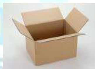
Рис.6. Пример коробки для цукатов.

Упаковочные материалы, которые будут использоваться в производстве – это коробки, полипропиленовая пленка (для производства малых упаковок для внутреннего рынка). Для производства потребуется упаковочных материалов в количестве 500 коробок в месяц (1 короб на 20 кг).