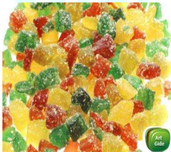
Рис 1. Смесь различных цукатов

Цукаты готовят из различных плодов, а также из зелёных грецких орехов, корок дыни, арбуза, а также из варенья-полуфабриката. Согласно требованиям отраслевого стандарта СССР «Цукаты. ОСТ 18-29-71», качественные цукаты должны содержать не менее 80% сухих веществ. Другими словами, этот продукт не должен быть похож на варенье. Слипшиеся между собой в единый ком цукаты - откровенный брак.