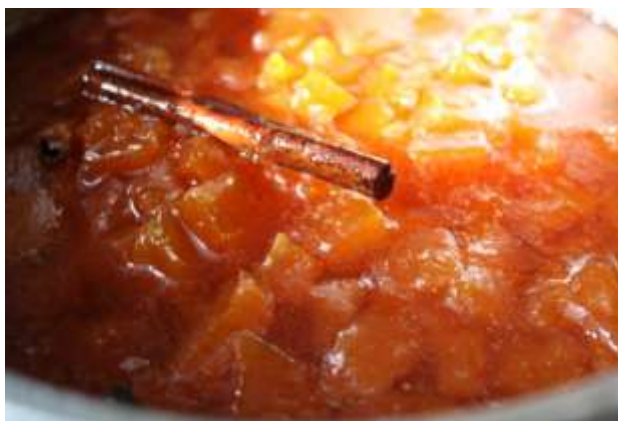
Рис 7. Цукаты после варки