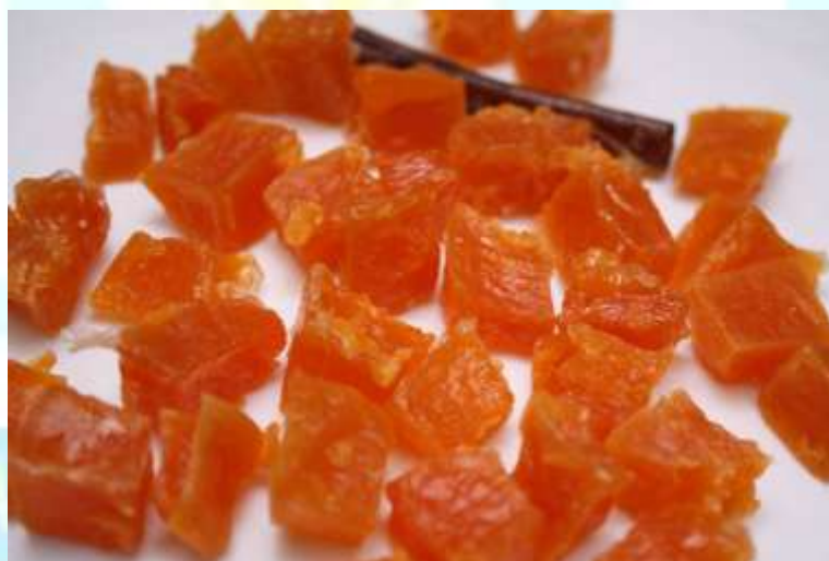
Рис 8. Цукаты после охлаждения

Г) Положительно влияет на срок хранения продукции.